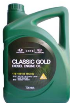
6 л - 05200-00610