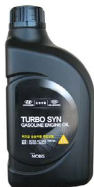
1 л - 05100-00141