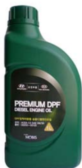
1 л - 05200-00120

Новейшее синтетическое беззольное моторное масло разработано эксклюзивно для HYUNDAI и KIA для новейших дизельных двигателей выпуска с 2007/08 года. Разработано для обеспечения оптимального срока службы сажевого фильтра в дизельных двигателях. Это масло рекомендуются для всех дизельных двигателей с сажевым фильтром. Соответствует высоким на сегодняшний день требованиям HYUNDAI и KIA к качеству. Категория ACEA C3.