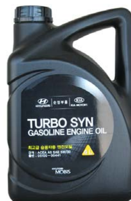
4 л - 05100-00441