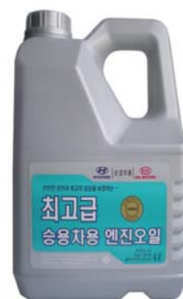
4 л - 05100-00441