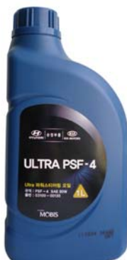
1 л - 03100-00130

Специальная синтетическая жидкость зелёного цвета для гидроусилителя руля автомобилей Hyundai, KIA концерна Hyundai Motor Company (HMC).