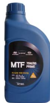
1 л - 04300-00140