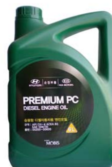
6 л - 05200-00600