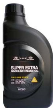
Оригинальный номер 1 л - 05100-00110

Полусинтетическое моторное масло с улучшенными эксплуатационными характеристиками. Рекомендуется для всех типов бензиновых двигателей концерна Hyundai Kia в которых автопроизводитель рекомендует применять масла с вязкостью SAE 5W-30 и уровнем качества API SL и ILSAC GF-4. Содержит тщательно подобранные присадки для достижения оптимальных эксплуатационных характеристик. Его смазывающие свойства сохраняются даже при интенсивном вождении благодаря качеству используемого базового масла и присадок. Противодействует отложению сажи и нагара, способствует содержанию двигателя в чистоте и обеспечивает отличное состояние сальников. Гарантирует лёгкий запуск и смазывание двигателя в холодную погоду и представляет собой минеральное масло исключительного качества с превосходными эксплуатационными характеристиками. Масло с добавлением высококачественных присадок, поддерживает превосходные эксплуатационные характеристики двигателя и малый расход топлива, поэтому является самым распространенным маслом. Категория качества API SL, ILSAC GF-3.