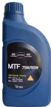
1 л - 04300-00110

Всесезонное полусинтетическое трансмиссионное масло, совместимо со всеми материалами уплотнений и эластомерными материалами, а также с металлами и сплавами, используемыми в трансмиссиях автомобилей Hyundai и Kia. Тщательно подобранный высокоэффективный пакет присадок и синтетическая технология производства базовых масел позволяют сохранять исключительную текучесть при низких температурах и прекрасные синхронизирующие свойства в различных эксплуатационных условиях, одновременно обеспечивая лёгкое переключение передач. Продукт обладает великолепными вязкостными и противоизносными характеристиками, благодаря новейшей технологии присадок обеспечивает сверхвысокую защиту от износа в широком диапазоне температур. Обеспечивает очень легкое переключение передач, обладает высокими синхронизирующими свойствами одновременно с надежной защитой от износа гипоидных и цилиндрических передач. Обладает превосходными низкотемпературными свойствами, гарантирует смазывание всех пар трения даже при очень низких температурах. Высокие антиокислительные свойства гарантируют чистоту деталей трансмиссии.