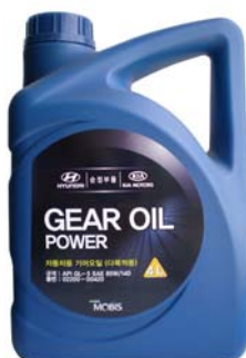
4 л - 02200-00420