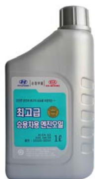
1 л - 05100-00141

Современное синтетическое энергосберегающее моторное масло, рекомендованное к всесезонному применению в двигателях автомобилей Hyundai и Kia с турбонаддувом и без него. Обязательно к применению для обеспечения устойчивой работы двигателей с CVVT (система изменения фаз газораспределения выпуска компании Hyundai), начиная с моделей двигателей 2L Beta I4 (автомобили Hyundai Elantra и Kia Spectra с 2005 года выпуска), Alpha II DOHC (автомобили Hyundai Accent/Verna, Tiburon, Kia see'd с 2006 года выпуска). Отличные температурно-вязкостные характеристики обеспечивают надежную защиту двигателя от износа во всем диапазоне рабочих температур. Синтетическая основа масла обеспечивает лёгкий холодный пуск двигателя даже при экстремально низких температурах. Высокая стабильность вязкостных характеристик в течение всего срока службы способствует экономии топлива. Не оказывает вредного воздействия на самые современные системы очистки выхлопных газов. Категории API SM, ILSAC GF-4, ACEA A3