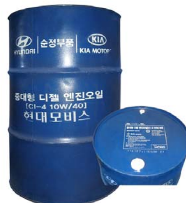
200 л - 05200-48CA0