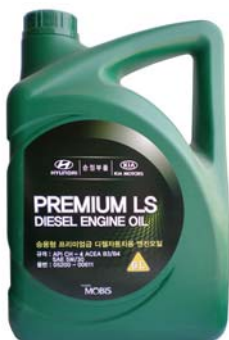
6 л – 05200-00611