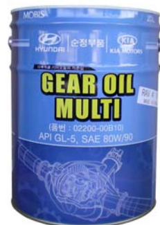
20 л - 02200-00B10

Всесезонное трансмиссионное масло для использования в широком ряде механизмов с прямозубыми, косозубыми и коническими шестернями, совместимо со всеми материалами уплотнений и эластомерными материалами, а также с металлами и сплавами, используемыми в трансмиссиях автомобилей Hyundai и Kia. Создано из минеральных масел высшей очистки, с использованием самых современных противоизносных, антифрикционных, антиокислительных, антипенных и других присадок. Специально подобранные компоненты обеспечивают легкое переключение передач трансмиссии и одновременно гарантируют высокую защиту от износа для шестерен и подшипников. Не образует пену и эмульсии, обеспечивает постоянную смазку и максимальный отвод тепла. Превосходные пластические свойства обеспечивают смазывание при больших удельных давлениях. Превосходная защита от износа, гарантирующая длительную живучесть частей (зубчатые колёса, подшипники, валы, переключатели, и т. п.). Особые вязкостно-температурные свойства этого масла позволяют использовать его всесезонно в широком интервале температур и обеспечивают текучесть при низких температурах. Высокий показатель вязкости гарантирует плавную работу элементов трансмиссии при любых температурах эксплуатации.