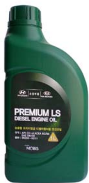
1 л - 05200-00111

Полусинтетическое моторное масло для дизельных двигателей. Предотвращает образование нагара, окисление и коррозию. Обладает хорошими моющими свойствами. Категория API CH-4.