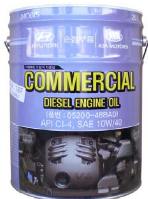
20 л - 05200-48BA0