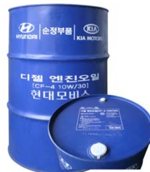
200 л - 05200-00C10